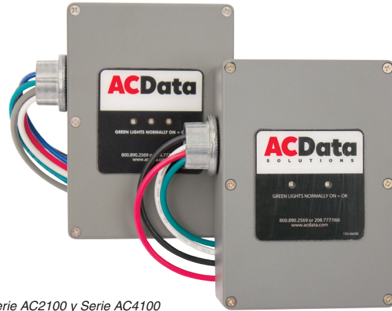
Serie AC2100 y Serie AC4100

AC1100-F-07 • AC2100-F-07 • AC4100-F-07 • AC1100M-F-07 • AC2100M-F-07 • AC4100M-F-07